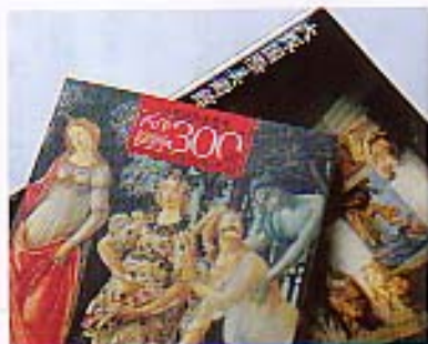
お土産に図録はいかが、「西洋絵画300選」。