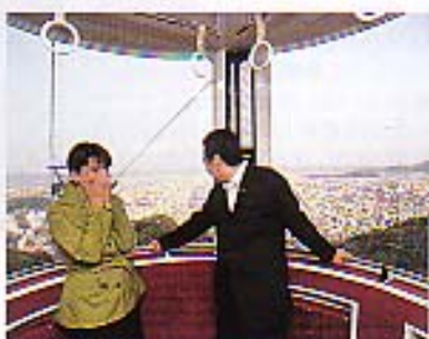
「河渡おどり会館」から、ロープウェイで眉山に登る。時と場合で夜景も楽しめる。