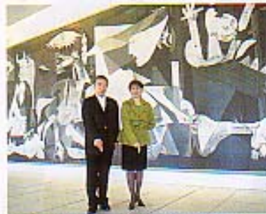
《ゲルニカ》を背に「sulo goya」のポーズ。