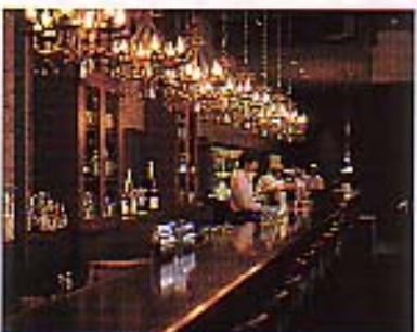
コロニアルムードに満ちたロング・バー。