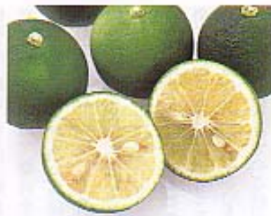
スダチはまさに、徳島文化の精髓である。