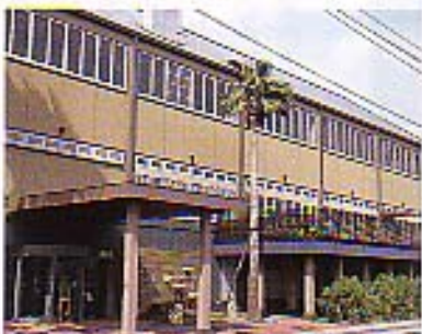
「THE PACIFIC HARBOR」の潇洒な外観。