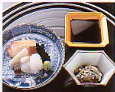
厚めに切って固い部分を外し、飲み込むときに鮎の香りが残る「へぎ造り」の妙。