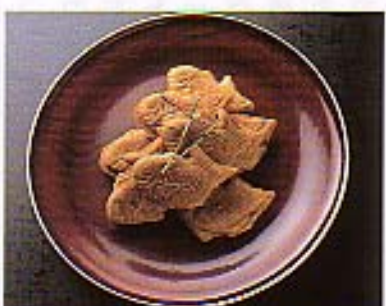
一尾の全長約7cm、青柳特製「たいやき」。