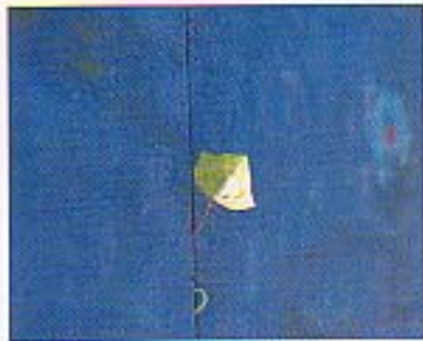
植物はすごい。いのちが見せるサプライズ。