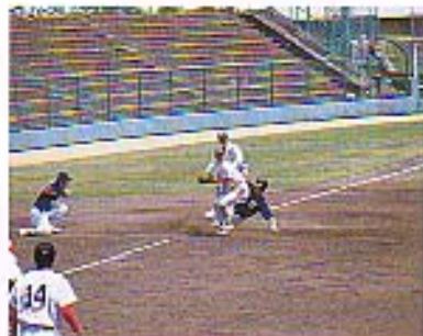
この日の観客は200人弱。しかし、開幕試合では7000人を超える観客動員数を記録。