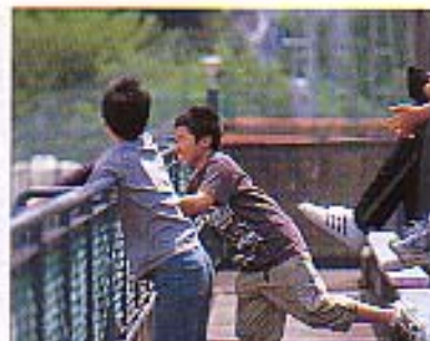
歓声をあげて、打球の行方を追う少年たち。