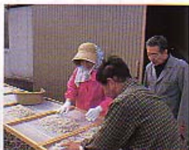
和田島で見た、ちりめんじゅこの天日干し。