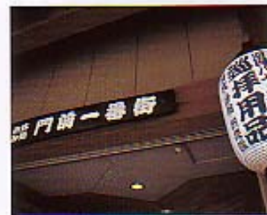
さすが一番礼所、お土産用品のすべてがここで揃う。やにわに浮かぶ菅直人さんの顔。