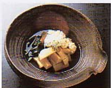
「鯛の真子と路、荷の炊き合わせ」。「青柳」では鯛の部位を8分類して処理している。