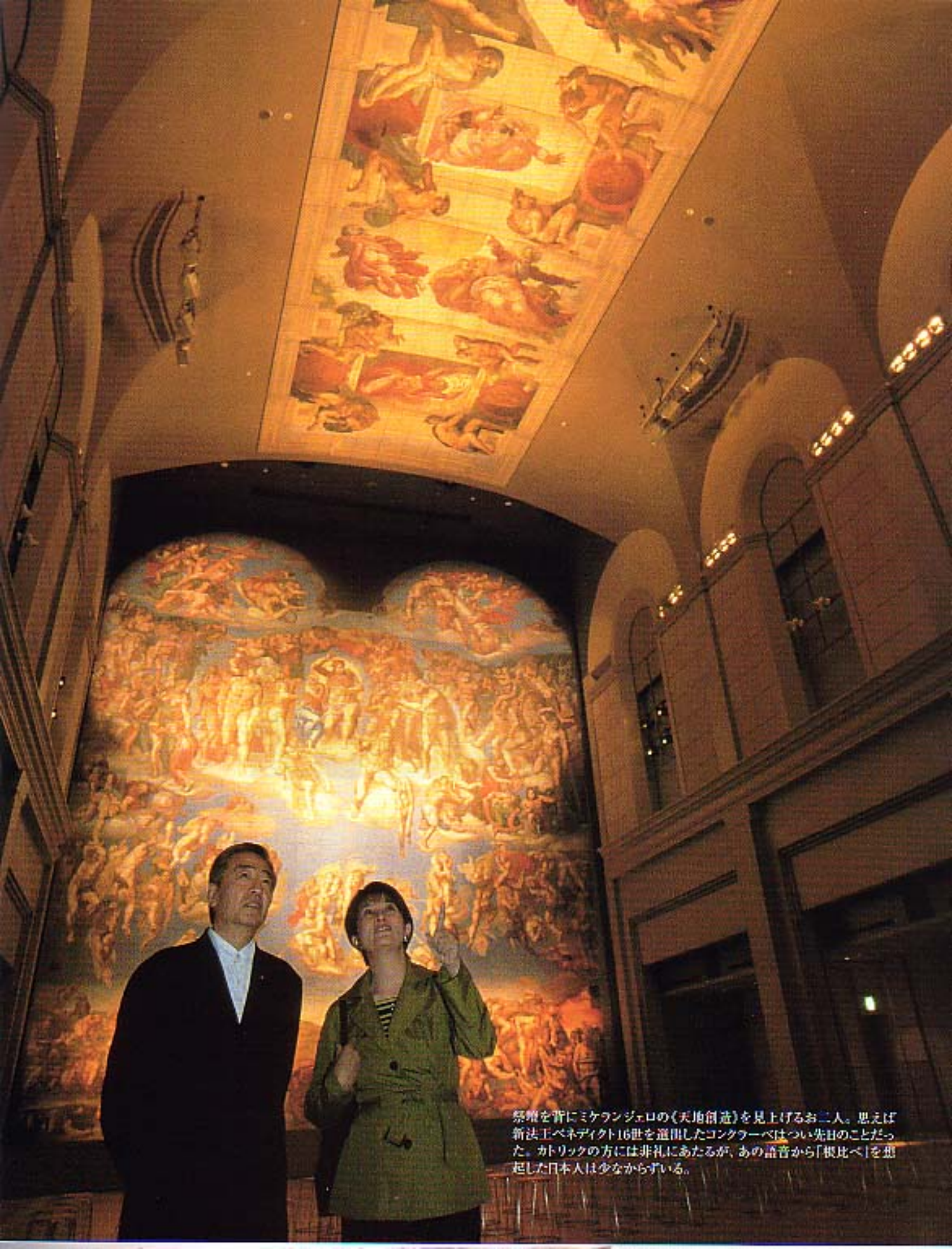
祭壇を背にミケランジェロの《天地創造》を見上げるお二人。思えば新法王ベネディクト16世を選出したコンクラーベはつい先日のことだった。カトリックの方には非礼にあたるが、あの語音から「根比べ」を想起した日本人は少なからずいる。