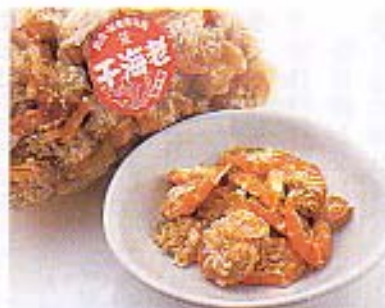
求めてやまなかった和田島産「干しエビ」。スダチを絞って、お醤油数滴をかけて食す。