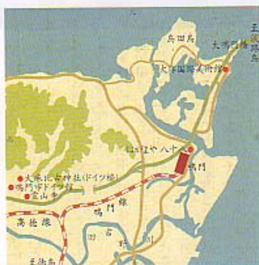
鳴門市のドイツ館

一九七四年に鳴門市はドイツ・リニーネブルク市と姉妹都市協約を締結。草の根の国際交流は三十年以上続き、今年はドイツ年を祝うイベントが目白押しだという。