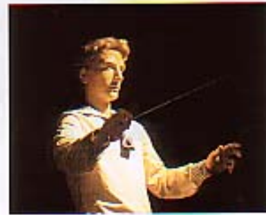
ドイツ館では「人形による第九演奏会」が開催されている。指揮者の顔に見覚えが……。