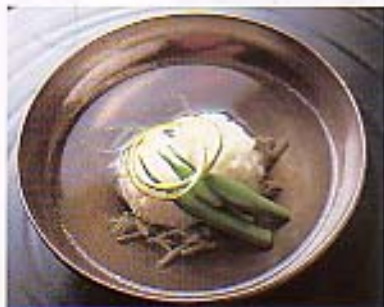
「鮎の取物仕立て」。夏らしい銀舟絵の碗。彩りもまた、日本料理の「美」。