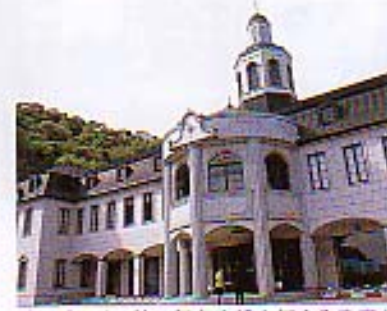
馬門市ドイツ館。収容生活を伝える豊富な資料、人形や模型を使った展示が楽しい。