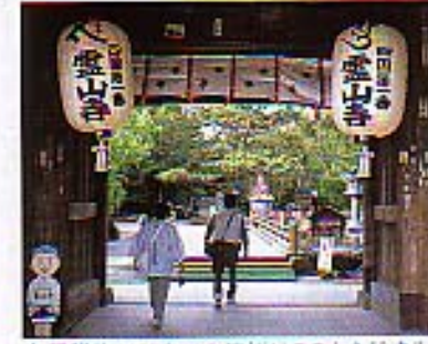
全行程約1450キロの巡拝はここから始まる。