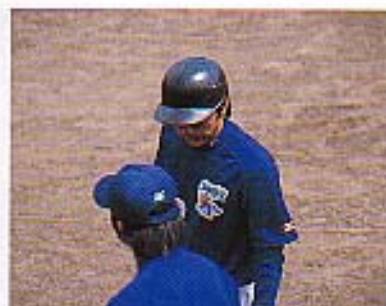
目にあざやかな「藍色」のユニフォーム。