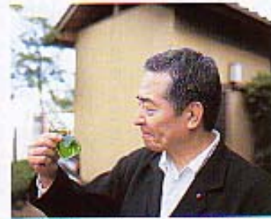
甘懐かし「ニッキ水」。飲んで後悔する国。