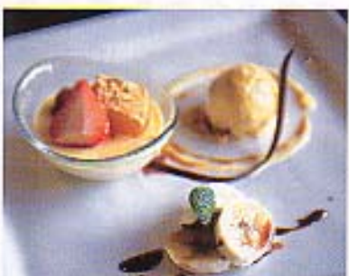
極上のスイーツをいただきますながら、シガーをくゆらす。スローダウンする時間。