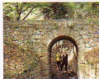
大塚北古神社裏に架かる「ドイツ橋」。骨髄と大塚町住民との深い交流の証だそうだ。