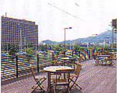
対岸に県庁舎を望むオープン・デッキ。