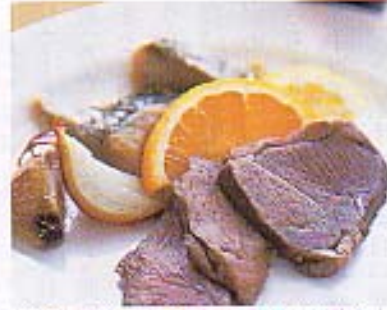
修復後の絵から再現された「最後の晚餐」。館内レストランのランチメニューである。