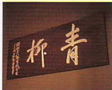
源とした字形。清楚で伸びやかな「青柳」の文字。「八十二翁白居軒吉兆書」とある。