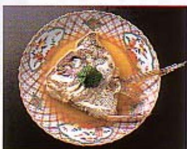
勇門鯛の「淡々煮」。一回、無言で箸を動かして骨をつまみ、まさに淡々と食すのみ。