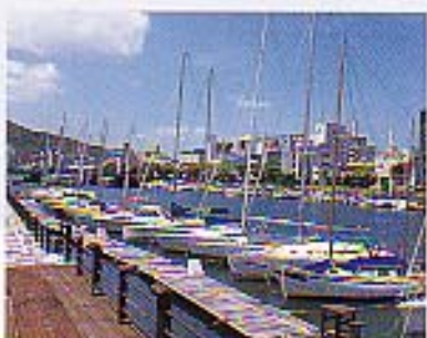
新可川の両岸に数十隻のヨットが浮かぶ。