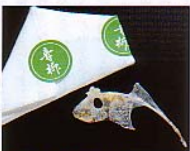
王冠を、かぶっているような、「鯛の鯛」。