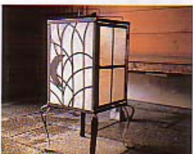
意匠が凝らされた灯籠に、いま火が入った。