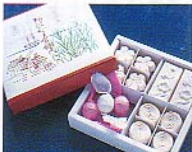
徳島自慢の一品、四国桃善郷の「和三益総上」